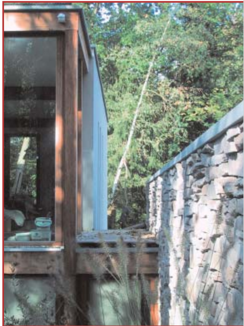
Depuis la rue, la façade est fermée. Vers l'arrière elle s'ouvre pour englober le jardin et les vues. Une construction aux détails maîtrisés.